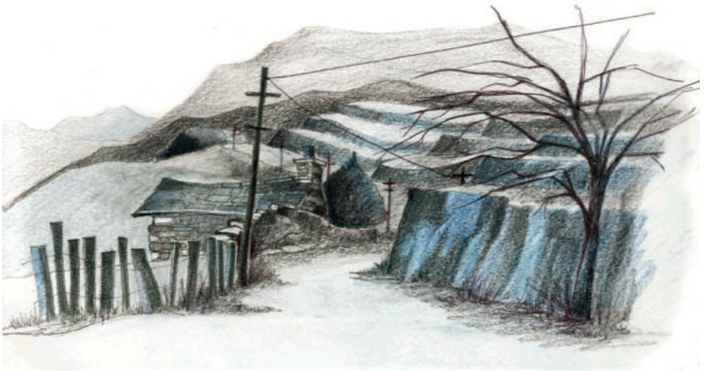
Edrych o Fwlch Llanberis tuag at Chwareli Dinorwig Dinorwic Quarries from the Llanberis Pass

Much of Dinorwig Quarry is now part of Padarn Country Park and the Welsh Slate Museum.